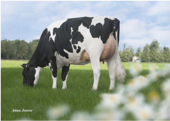
De Oosterhof DG Rose RDC VG-89