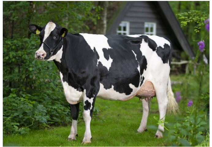
De Oosterhof Dg Rose RDC VG-89

Sheepster x Gameday x GP-84 AltaAltuve RDC x VG-86 Salvatore Rc x VG-89 Rubicon x GP-83 Aikman RDC x VG-85 Man-O-Man x VG-87 Mascol x VG-88 Durham x EX-90 Rudolph