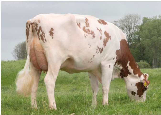
Lakeside Ups Red Range VG-86