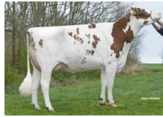
Lakeside Ups Red Range VG-86