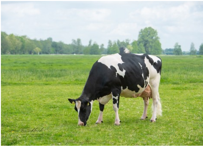
De Oosterhof DG Rose RDC VG-89