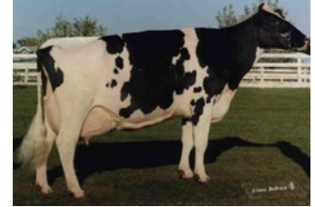
Golden-Oaks Mark Prudence EX-95

Holysmokes x GP-84 Crisalis RF x GP-84 AltaAltuve RDC x VG-86 Salvatore Rc x VG-89 Rubicon x GP-83 Aikman RDC x VG-85 Man-O-Man x VG-87 Mascol x VG-88 Durham x EX-90 Rudolph