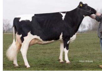
Sunday ALH Prudence VG-88