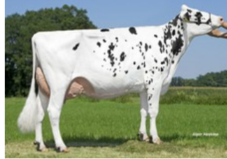
Schreur Serena 7 P VG-85