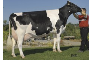
Gen-I-Beq Durham Sherry VG-87

Borax-Red x Sailor PP x VG-87 Apo Red PP x VG-85 Silver x GP-83 Earnhardt P x GP-82 Colt P x VG-85 Socrates x VG-87 Goldwyn x VG-87 Durham x VG-86 Formation Hoornloze Borax-Red uit de Serena's bij Reurslag