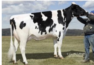
Gold-N-Oaks S Marbella VG-89