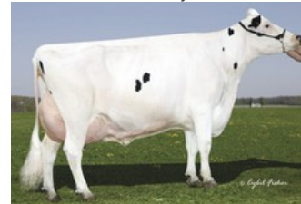
Gold-N-Oaks Morty Malibu EX-94

Boero RF x Freestyle-Red x GP-84 Riveting x EX-91 Superhero x Silver x GP-82 Supersire x VG-87 Bookem x VG-88 Man-O-Man x VG-89 Shottle x EX-94 Morty