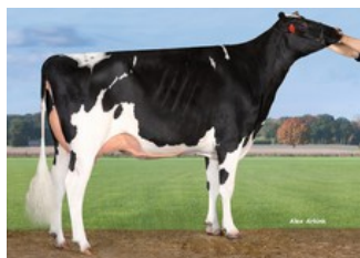
Pen-Col Superhero Mistral EX-91