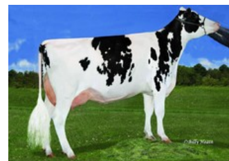
Ms Gold-N-Oaks Maybaline VG-88