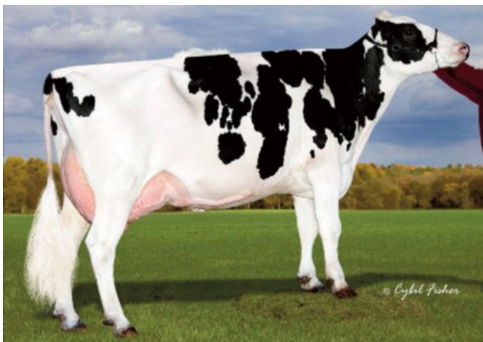
Pen-Col Bookem Mia family member