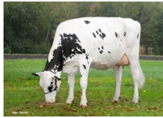
Diekers K&L DL Whiskey RDC VG-85