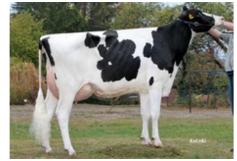
KHE Isolde VG-87