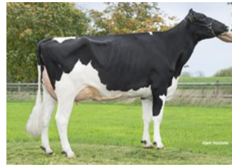
Poppe K&L Gorgina