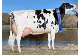
KHE Iowa EX-92, full sister to KHE