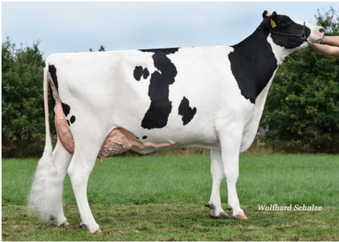
ZB Supersire Mata VG-88