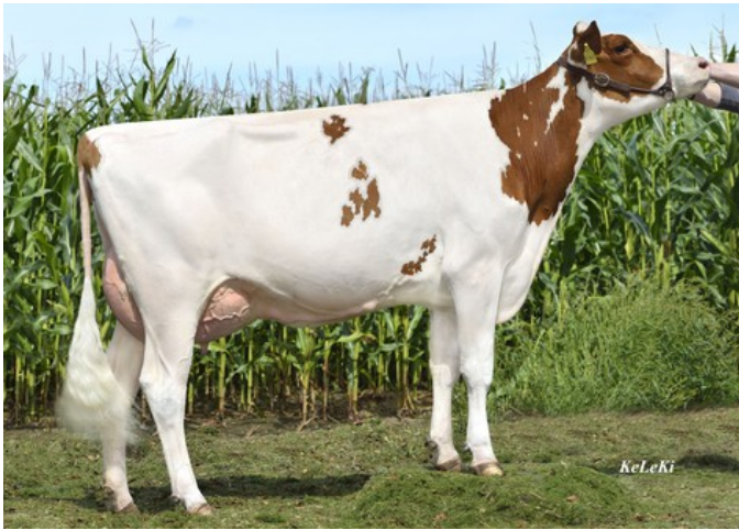
WEU Dream Red VG-87