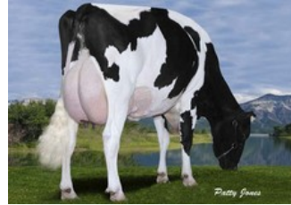
Gen-I-Beq Goldwyn Secret RC VG-87