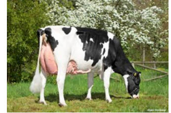
KHE I'm Good VG-88

Member PP Red x Star P RDC x Durable x VG-88 Gymnast x VG-87 Rubicon x VG-89 Shotgun x VG-88 Windbrook x VG-88 Jeeves x VG-85 Goldwyn x VG-85 Juror Ford