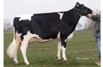
Sunday ALH Prudence VG-88

Fred Red P x Star P RDC x VG-87 AltaAltuve RDC x VG-86 Salvatore Rc x VG-89 Rubicon x GP-83 Aikman RDC x VG-85 Man-O-Man x VG-87 Mascol x VG-88 Durham x EX-90 Rudolph