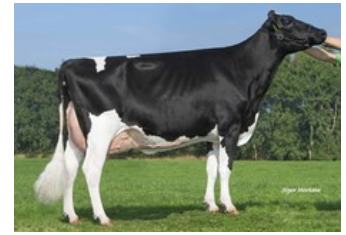
A-L-H Australia RDC VG-87