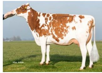
Batouwe Salsa Aiko Red VG-85