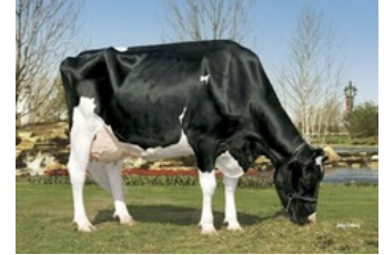
Kamps-Hollow Durham Altitude EX-95

Rammstein Red x Freestyle-Red x VG-85 Swingman Red x Alaska Red x VG-85 Salsa RC x VG-87 Supersire x VG-85 Alexander x EX-91 Goldwyn x EX-95 Durham x EX-93 Prelude