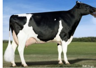
KHW Goldwyn Aiko RDC EX-91