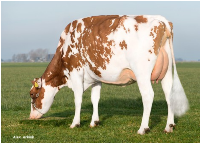
Batouwe Salsa Aiko Red VG-85