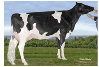
Gen-I-Beq Bolton Silence VG-85