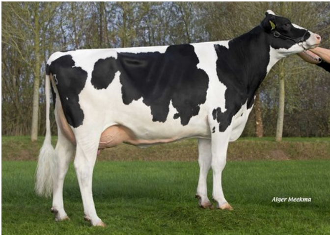
Poppe Fienchen 803 RDC VG-86