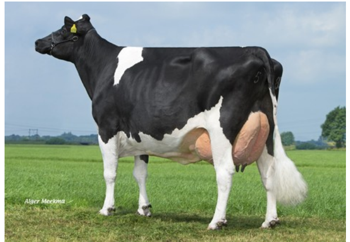
Poppe Fienchen 580 RDC VG-89

Mask Red x Star P RDC x VG-86 Match P RDC x VG-85 Rubi-Agronaut x VG-85 Apoll P Red x VG-86 Danillo x VG-89 Stol Joc x VG-85 Lightning RDC x GP-84 Konvoy x VG-85 BW Marshall