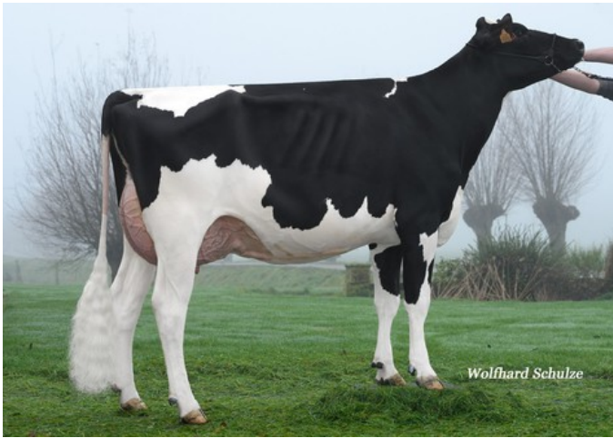
Lis K&L Xemmi 7970 VG-88