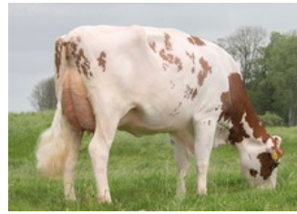
Lakeside Ups Red Range VG-86