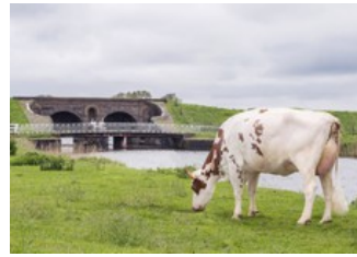
Lakeside Ups Red Range VG-86