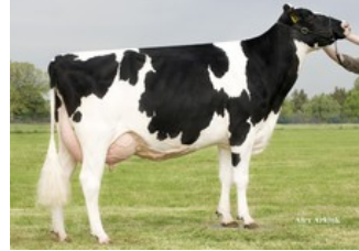
Holbra Mascos Pam VG-87