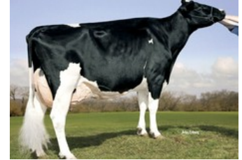
Kamps-Hollow Durham Altitude EX-95

Ranger-Red x VG-86 Solitair P Red x Alaska Red x VG-85 Salsa RC x VG-87 Supersire x VG-85 Alexander x EX-91 Goldwyn x EX-95 Durham x EX-93 Prelude x EX-94 Jubilant RF