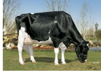
Kamps-Hollow Durham Altitude EX-95