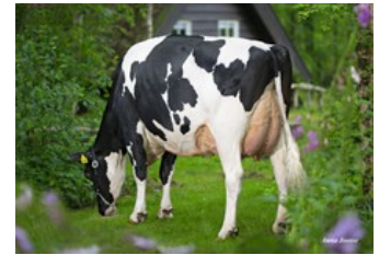
De Oosterhof Dg Rose RDC VG-89