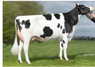
Koepon Altuve Range 7 RDC VG-87