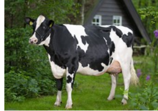
De Oosterhof Dg Rose RDC VG-89