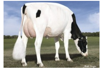
Des-Y-Gen Planet Silk EX-90