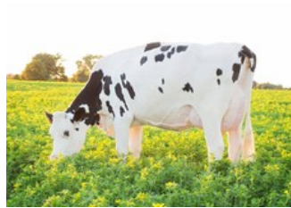
Dymentholm Sunview Sunday VG-87