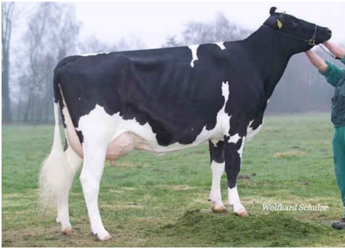
KNS Hispania VG-88