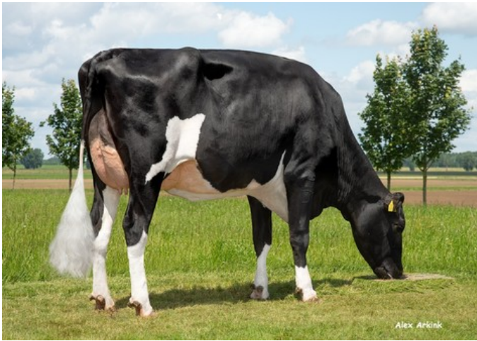
3STAR OH Mazzali GP-84