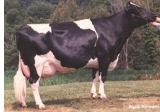
Jeta Commotion Cupid-ET VG-88