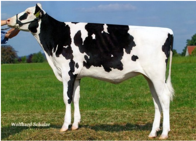
KNS Goldencross VG-85