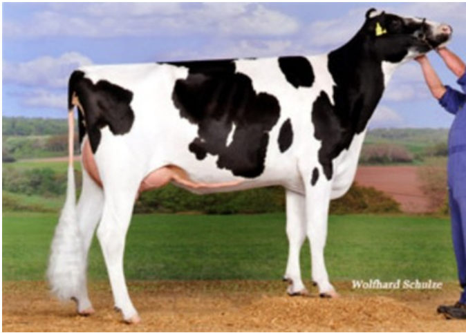
Tramilda KNS Cutchen VG-88