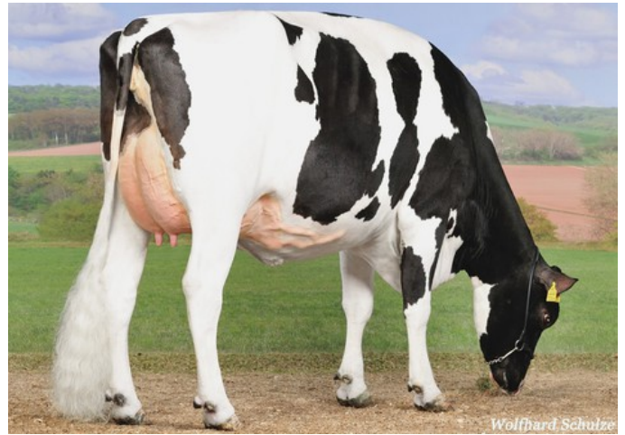
KNS Dalista VG-87

VG-87 Balisto x GP-84 Shamrock x VG-85 Man-O-Man x EX-91 Goldwyn x EX-90 Lee x EX-93 Integrity x VG-85 Prelude