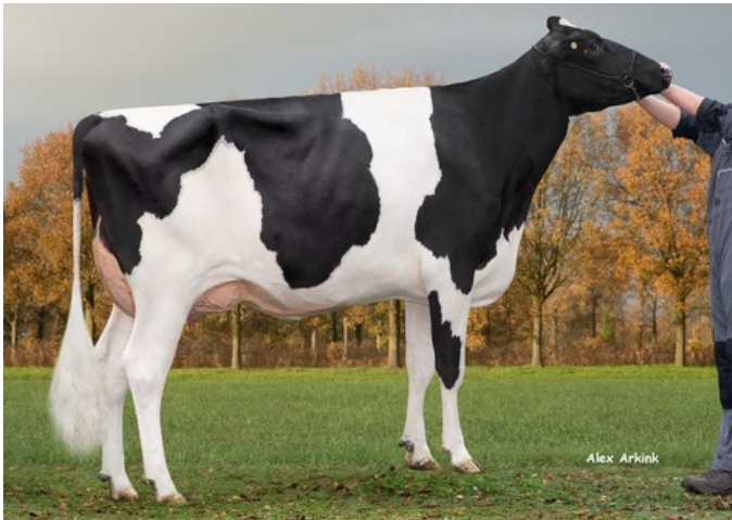
K&L OH Mabel