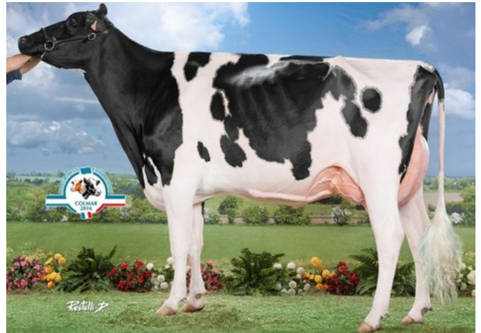
Hermine Tual, family of Maybelline VG-85

Ridercup x AltaZazzle x Kenobi x Granite x VG-85 Rubicon x GP-84 Cashcoin x VG-86 Man-O-Man x VG-86 Shottle x GP-84 Finley x Brett