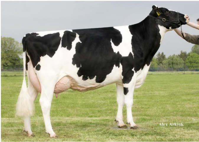
Holbra Mascol Pam VG-87