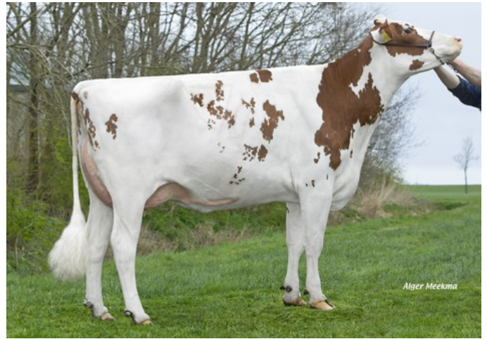
Lakeside Ups Red Range VG-86

Otezla-P* Rc x GP-84 Sputnik RDC x GP-84 AltaAltuve RDC x VG-86 Salvatore Rc x VG-89 Rubicon x GP-83 Aikman RDC x VG-85 Man-O-Man x VG-87 Mascol x VG-88 Durham x EX-90 Rudolph