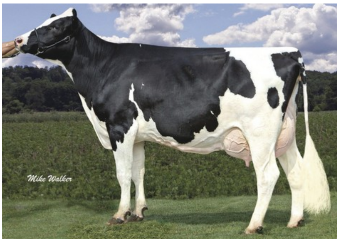
Coyne-Farms Ramos Jelly VG-85