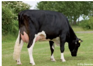
Tirsvad Juwel Ghana VG-88