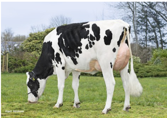
SPH Germania VG-86