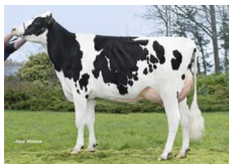
SPH Germania VG-86