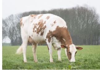
Koepon OH Rubels Range 17 Red VG-