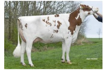
Lakeside Ups Red Range VG-86