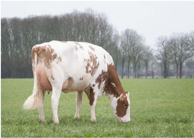
Koepon OH Rubels Range 17 Red VG-86