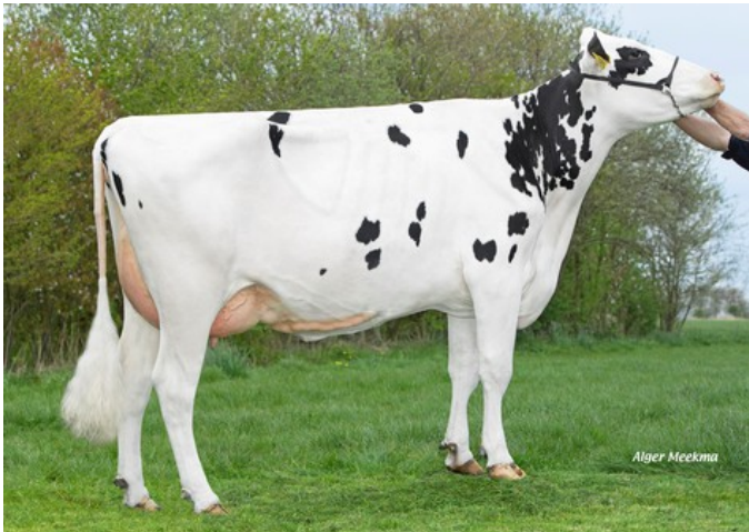
Koepon Date Range 10 RDC GP-84