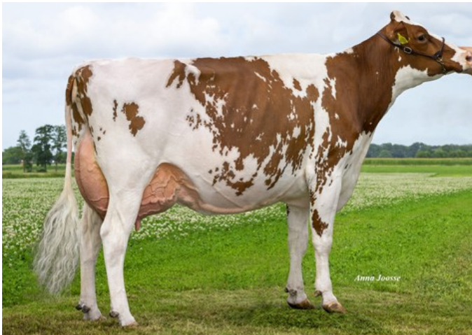
Visstein K&L SV Aderina Red VG-89