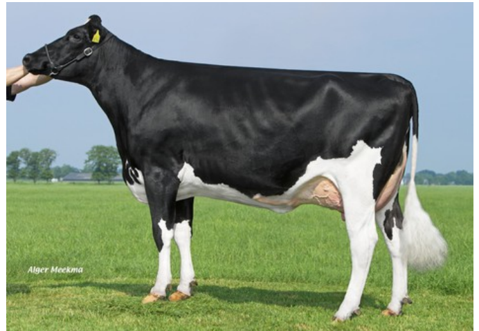
Willsbro K&L Nugget Aderyn RDC VG-87

Ridercup x VG-86 Rubels-Red x VG-89 Salvatore Rc x VG-87 Nugget RDC x VG-85 Supersire x EX-90 Superstition x EX-91 Goldwyn x EX-95 Durham x EX-93 Prelude x EX-94 Jubilant RF