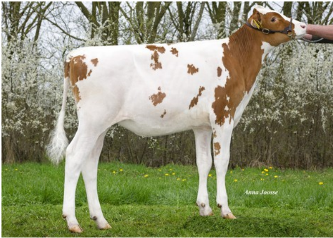
R&B Solitair Aisha P Red VG-86