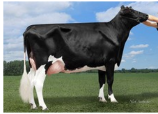
KHW Alxndr Ayako VG-85