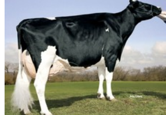
Kamps-Hollow Durham Altitude EX-95