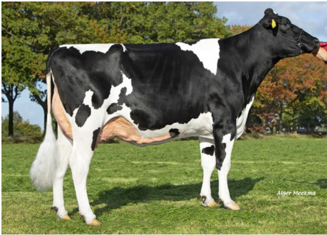
HET Adora Chanel VG-86