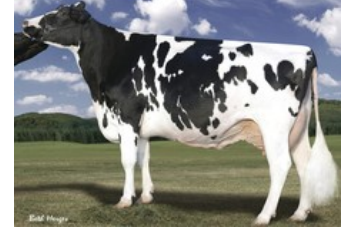
Larcrest Outside Champagne EX-90,

Monteverdi x VG-86 Copyright x VG-86 Adorable x VG-87 Balisto x VG-87 Beacon x VG-86 Ramos x EX-90 Outside x EX-93 Ked Juror x VG-85 Lindy x VG-87 Inspiration