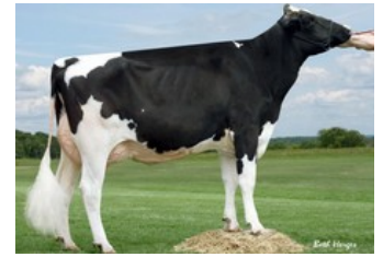
Larcrest Chenile VG-86