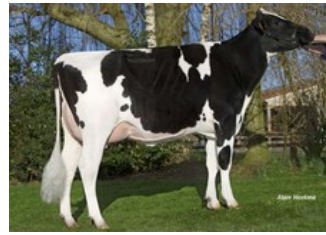
Roccafarm Beacon Chrissy VG-87