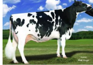
Larcrest Outside Champagne EX-90