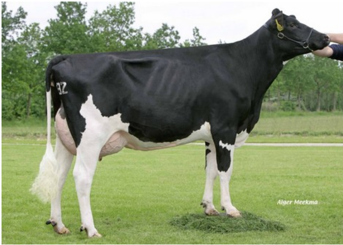
Newhouse Sneeker 422 VG-87