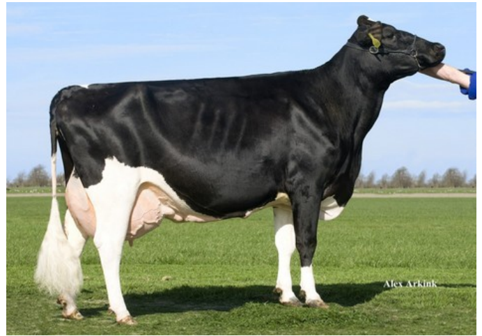
Newhouse Sneeker 247 VG-89

Endless RDC x VG-85 Floris x VG-86 Esperanto x VG-86 Checkers x VG-85 Balisto x VG-87 Stol Joc x VG-89 O Man x VG-89 Addison x VG-85 Jimtown x VG-85 Sunny Boy