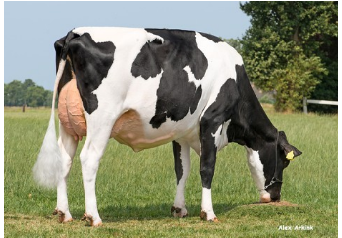
Holbra Malon 9 VG-88

Rioaveso x VG-87 Cameron x VG-88 Board x VG-88 Balisto x VG-87 Man-O-Man x VG-87 Mascol x VG-88 Durham x EX-90 Rudolph x EX-95 Chief Mark x EX-91 Sexation