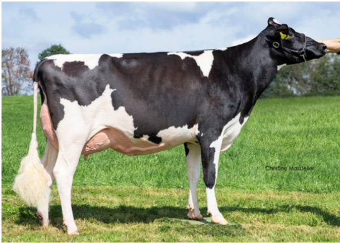
Welcome RUW Delicious VG-88