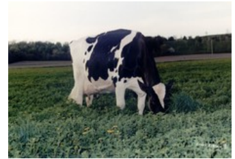
Golden-Oaks Mark Prudence EX-95

Perfect x VG-85 Charl x VG-85 Altatopshot x VG-89 Rubicon x GP-83 Aikman RDC x VG-85 Man-O-Man x VG-87 Mascol x VG-88 Durham x EX-90 Rudolph x EX-95 Chief Mark