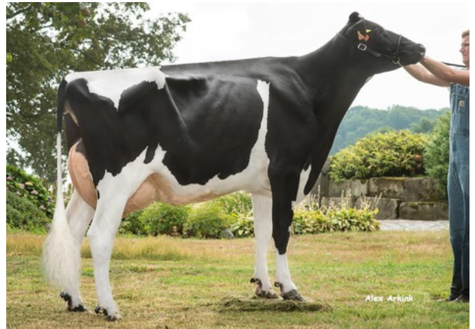
Maybelline Tual VG-85

Conway x GP-83 Einstein x Granite x VG-85 Rubicon x GP-84 Cashcoin x VG-86 Man-O-Man x VG-86 Shottle x GP-84 Finley x Brett x Lantz