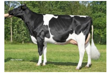
NRP Alisha RDC VG-89