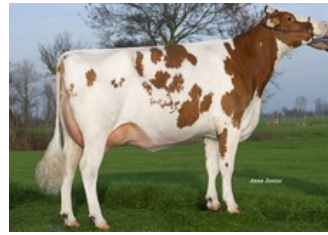
Batouwe Ailisha Salva Red VG-85