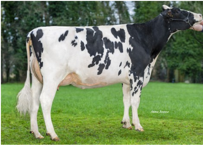
Batouwe WM Aimee RDC GP-83