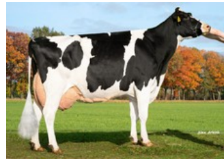
DG OH Donna RDC VG-89