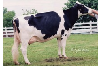
Mayerlane-DK Hiawatha EX-90

Parfect x VG-85 Charl x VG-85 Altatopshot x VG-89 Rubicon x GP-83 Aikman RDC x VG-85 Man-O-Man x VG-87 Mascol x VG-88 Durham x EX-90 Rudolph x EX-95 Chief Mark