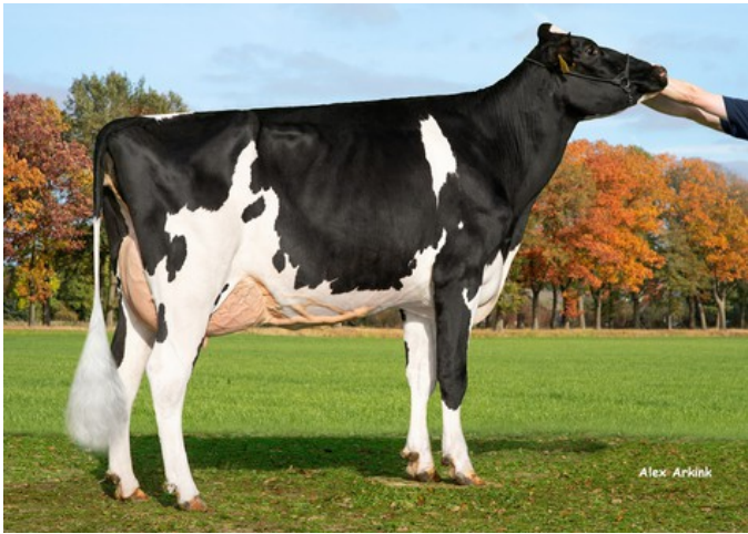
De Oosterhof DG Leida VG-85