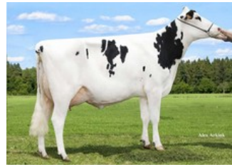
DKR Silence Secret RC VG-85