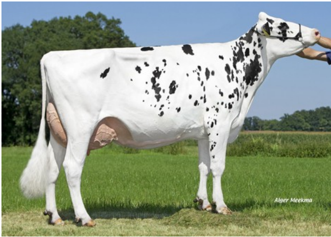
Schreur Serena 7 P VG-85