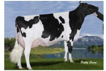
Gen-I-Beq Goldwyn Secret RC VG-87