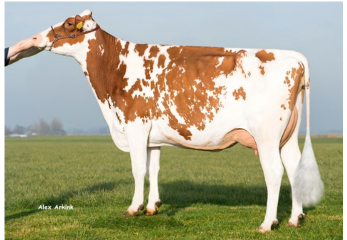
Batouwe Salsa Aiko Red VG-85

Flight Red x AltaTop-Red x Alaska Red x VG-85 Salsa RC x VG-87 Supersire x VG-85 Alexander x EX-91 Goldwyn x EX-95 Durham x EX-93 Prelude x EX-94 Jubilant RF