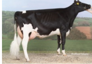
CCC Goldwyn Konny VG-87