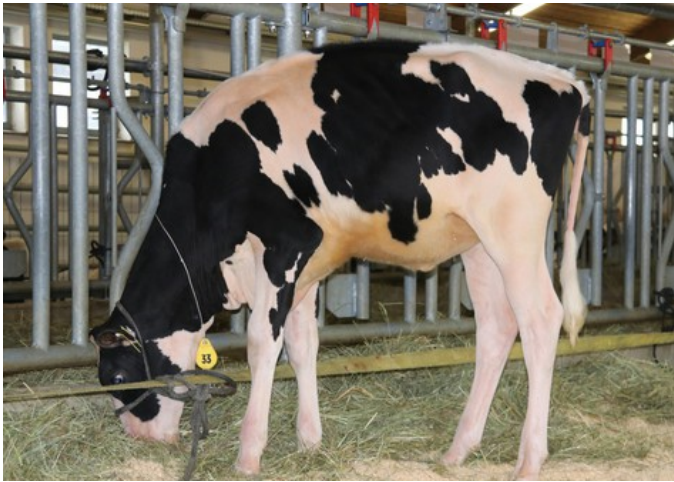
Wilder Holiday Season