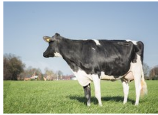
Wilder Hira VG-85