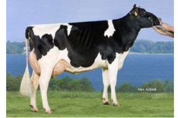
Giessen Praline 2 EX-91

Woody x GP-83 Noble x Charismatic x GP-80 Supershot x VG-86 Chevrolet x VG-87 Wonder x EX-91 Mr Burns RC x VG-85 Durham x EX-95 Rudolph x EX-94 Ultimate Hoge NVI uit de Amerikaanse Windy-Knoll-View Promis familie!