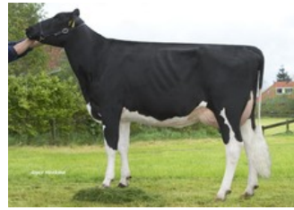
Giessen Praline 16 VG-87