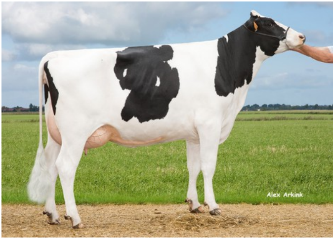
Josefien V/H Zomerbloemhof VG-86