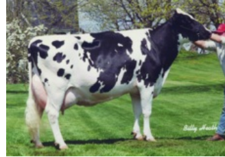
Windy-Knoll-View Ultimate Pala EX-94