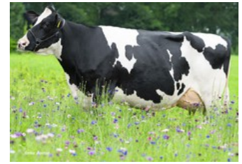
De Oosterhof Dg Rose RDC VG-89