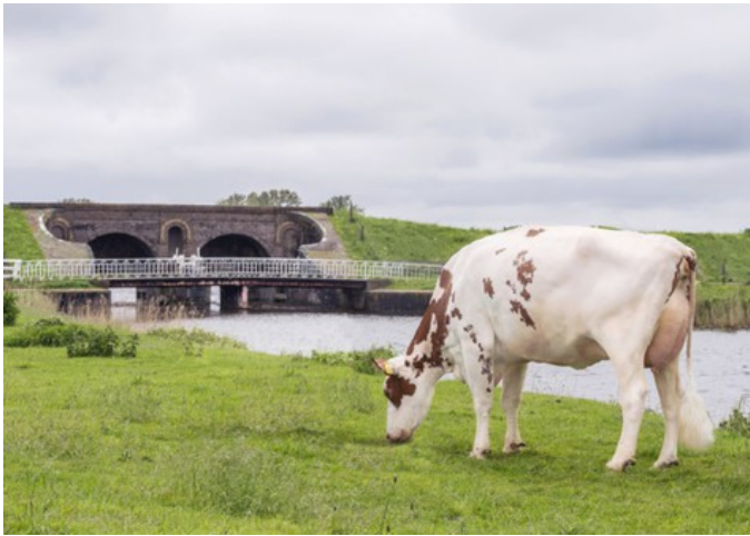
Lakeside Ups Red Range VG-86