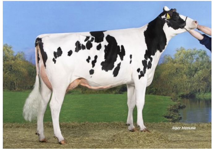
Koepon Mano Classy 93 VG-87

Ranger-Red x GP-83 AltaTop-Red x GP-83 Salvatore Rc x VG-86 Silver x VG-87 Man-O-Man x VG-85 Jeeves x VG-85 Shottle x VG-86 Simon x VG-86 Merrill x VG-88 Bell Elton